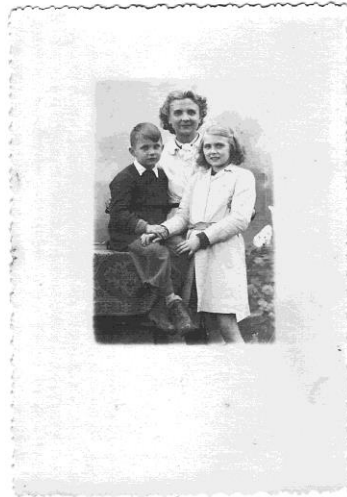
Février 1948 j'avais 11 ans