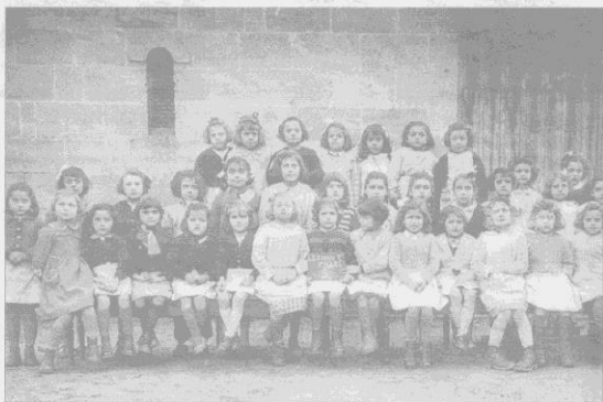
Une classe de l'école des filles en 1950

ANCIENS ÉLÈVES L'association Sur les bancs de l'école de Lormont dote son rassemblement annuel d'une animation ouverte à tous, une dictée pas trop difficile. Mouais