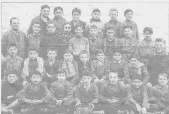
Une classe de l'école des garçons en 1955