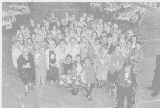
Retrouvailles féminines le 30 mai 2004