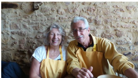
Voyage Monpazier 2015

Il parlait rarement de ses problèmes et lorsque la maladie l'a pris de court il a fait face avec courage en continuant ses activités jusqu'au bout avec lucidité et sagesse étant conscient de l'issue fatale.