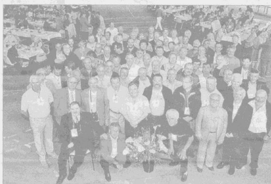
Retrouvailles masculines le même jour.