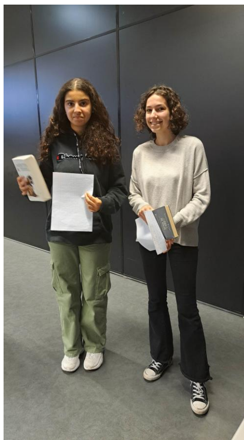
les jeunes gagnantes