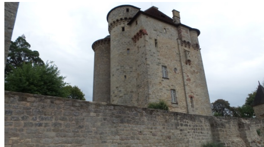
Le château de Plas