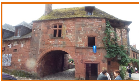
La maison de Sirène

Nous déambulons dans les ruelles en compagnie de personnages déguisés en vénitiens ce qui nous permet de découvrir des lieux magnifiques.