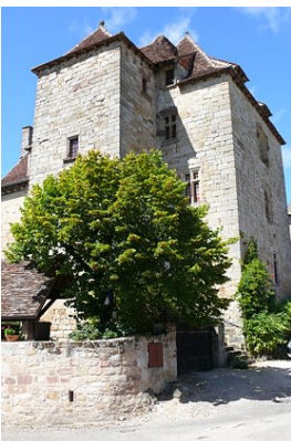
le château de la Johannie