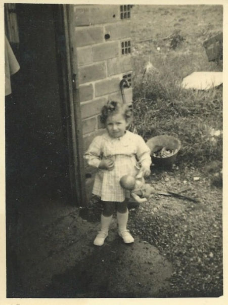
Devant la petite maison en briques rouges rue de Bordeaux

Après notre départ dans l'Ariège en 1954, les quatre garages sont restés libres mais les voitures faisaient de plus en plus leur apparition. Les garages ont été loués assez rapidement. Les demandes devenaient plus nombreuses alors mon père est venu construire une rangée jusqu'à la partie marécageuse.